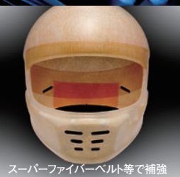
スーパーファイバーベルト等で補強