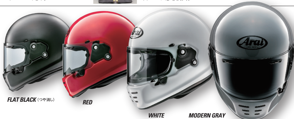
FLAT BLACK (つや消し)