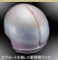
エアラートを施した新開発ライナ