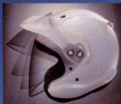
デュアルピボット開閉システム