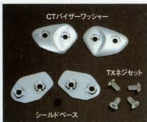
CTバイザーワッシャー