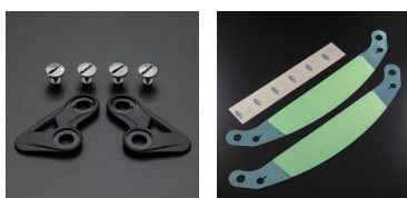
VR ネジセット | VR ティアオフシールド (クリアー)