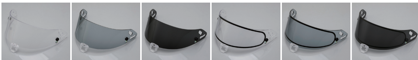
VR スタンダードシールド (クリアー) FIA 公認ラベル付 | VR スタンダードシールド (セミスモーク) FIA 公認ラベル付 | VR スタンダードシールド (スモーク) FIA 公認ラベル付 | VR ダブルレンズシールド (クリアー) FIA 公認ラベル付 | VR ダブルレンズシールド (セミスモーク) FIA 公認ラベル付 | VR ダブルレンズシールド (スモーク) FIA 公認ラベル付