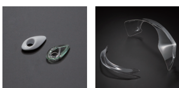
GP-6 ティアダクト (白) (クリアー) | VR PED